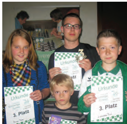
Die Sieger der Altersgruppen U10, U12, U14 und U16. Die Zweit und Drittplatzierten