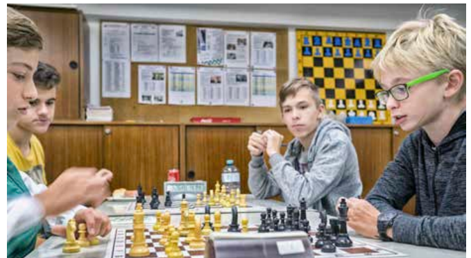
2 Fotos: Peter Kranzl