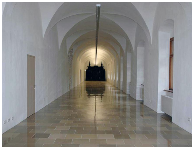
Kreuzgang im Schloss