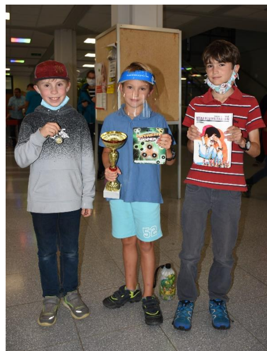
Gewinner der U8 (links) und U10 (rechts).