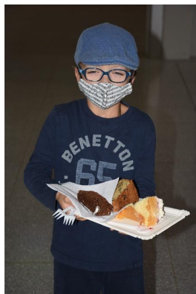
Eine kleine süße Stärkung zwischendurch schadet nicht.