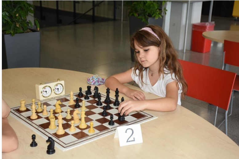
Unsere jüngste Teilnehmerin am Werke.