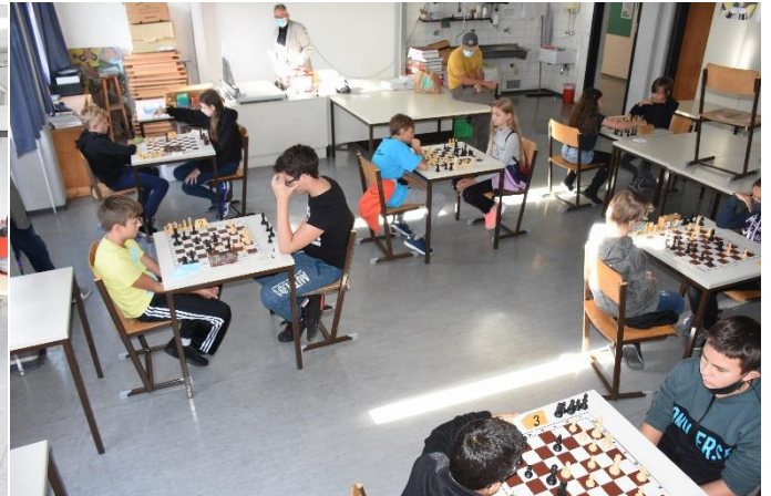
Hier werden die Spieler auf Abstand gehalten.