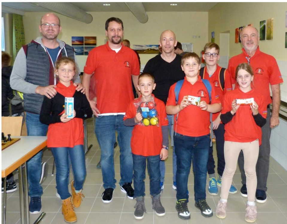
Am Samstag, den 30. Oktober, nehmen wir mit 5 Kindern am SL-Turnier in Riedau teil.

Die weiteren SL-Turnier fallen fast zur Gänze der Pandemie zum Opfer und werden abgesagt. So auch das geplante SL-Turnier in Hofkirchen am 15. Jänner 2022.