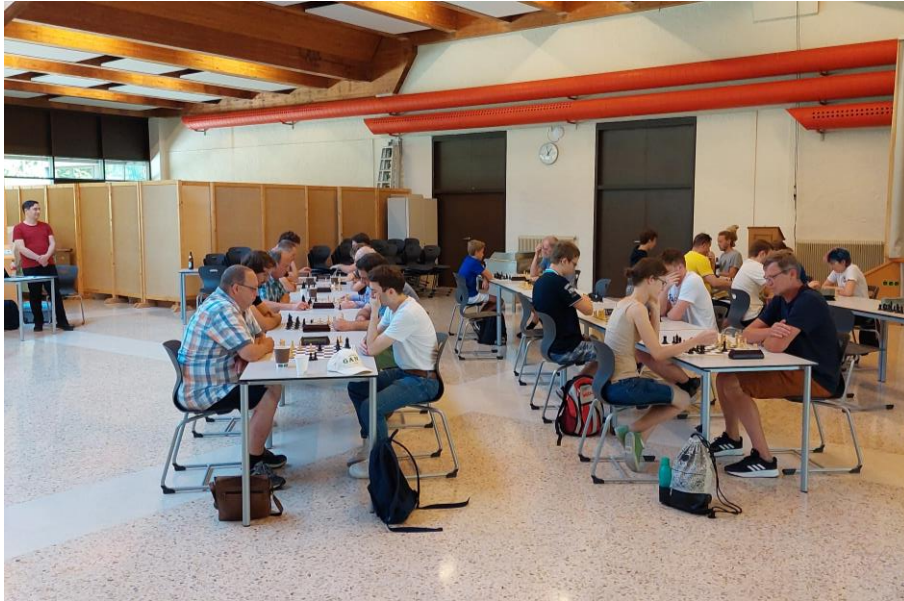
Impressionen vom Turnier