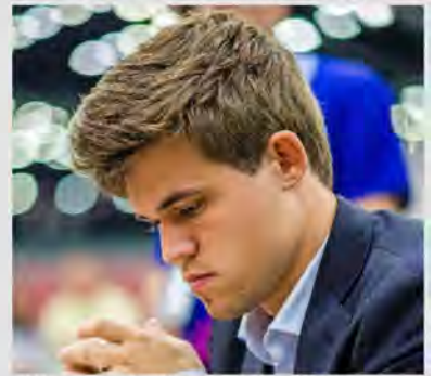
Magnus Carlsen, geb. 1990 in Tønsberg in Norwegen.