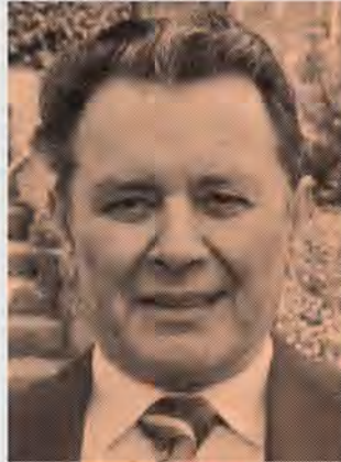
2010 Anton Weinzierl stirbt.

1983 Reichenthal verliert in der 1. Klasse Nord gegen Mauthausen I mit 1:7