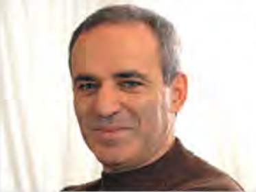
2006 Wiedervereinigung unter dem einen Verbund FIDE.