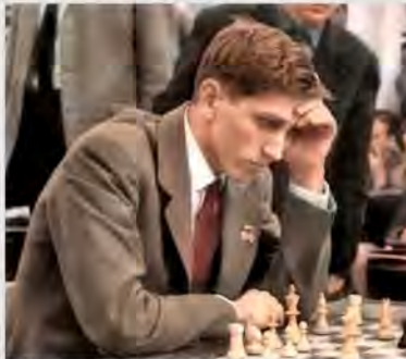
Bobby Fischer, 1943 Chicago–2008 in Reykjavík in Island.