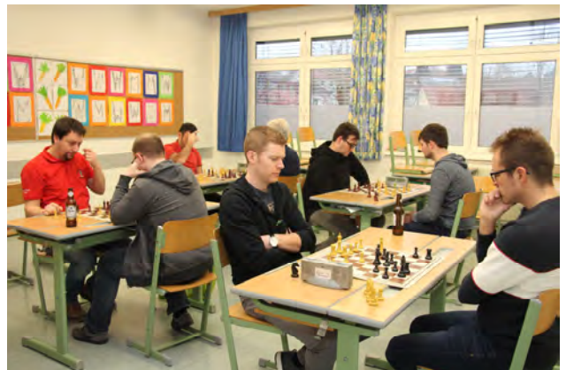
Schachamateure bei der Arbeit