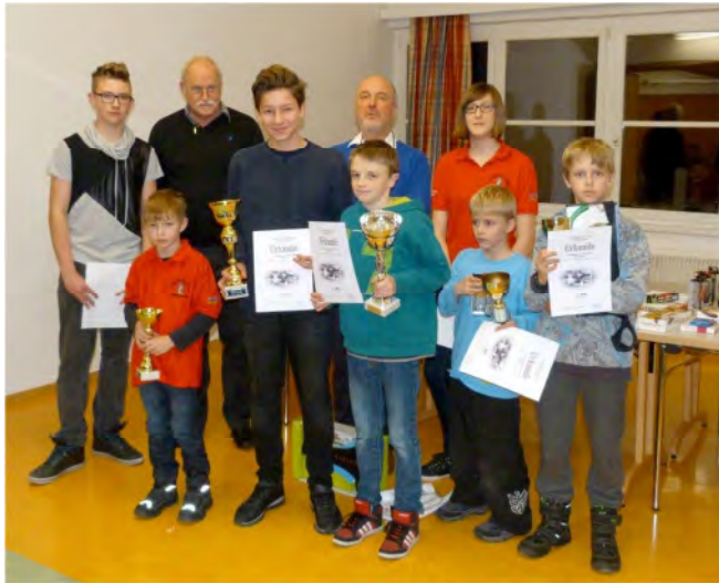
Die 2. Plätze

Die ersten Plätze in den Gruppen U10, U12, U14 und U16 mit dem jüngsten Teilnehmer.