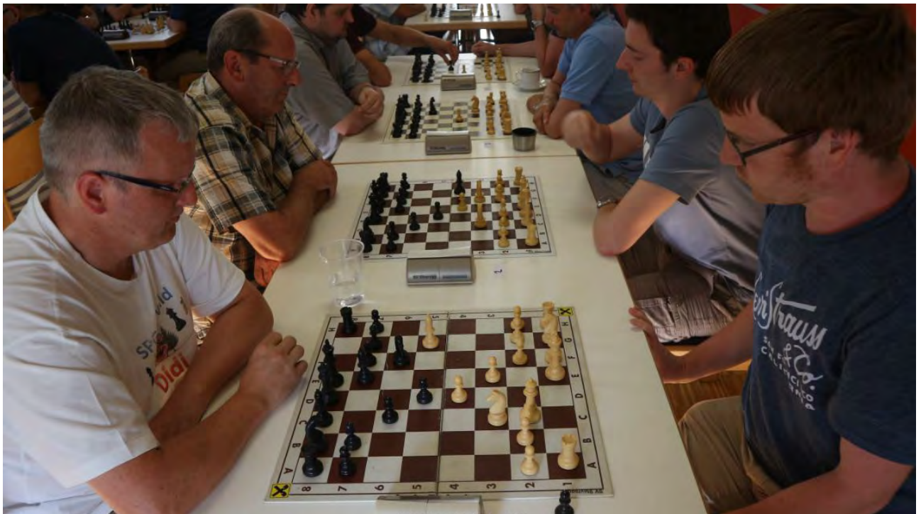
Die Spitzenpaarungen der 6. Runde mit dem Duell Vater gegen Sohn auf Brett 2.