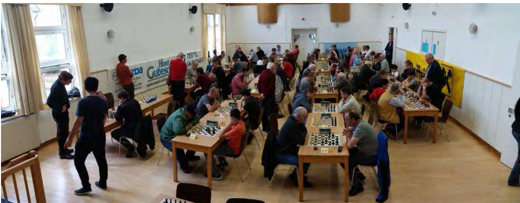
Blick in den vollen Turniersaal