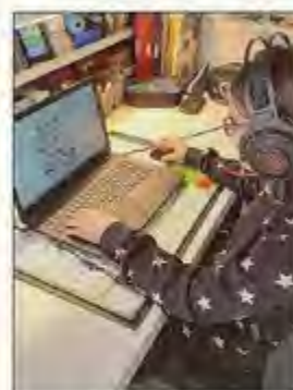
Nina Gaisberger beim Skype-Training