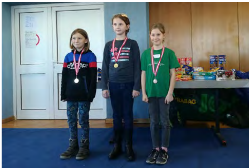
Siegerinnen der U10