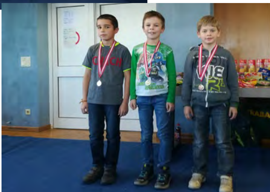
Sieger der U10