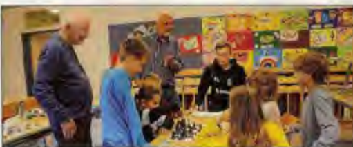
Spannend und unterhaltsam geht es bei den Trainings zu.

Am Donnerstag, 3. Oktober, in der NMS 2 Bad Goisern