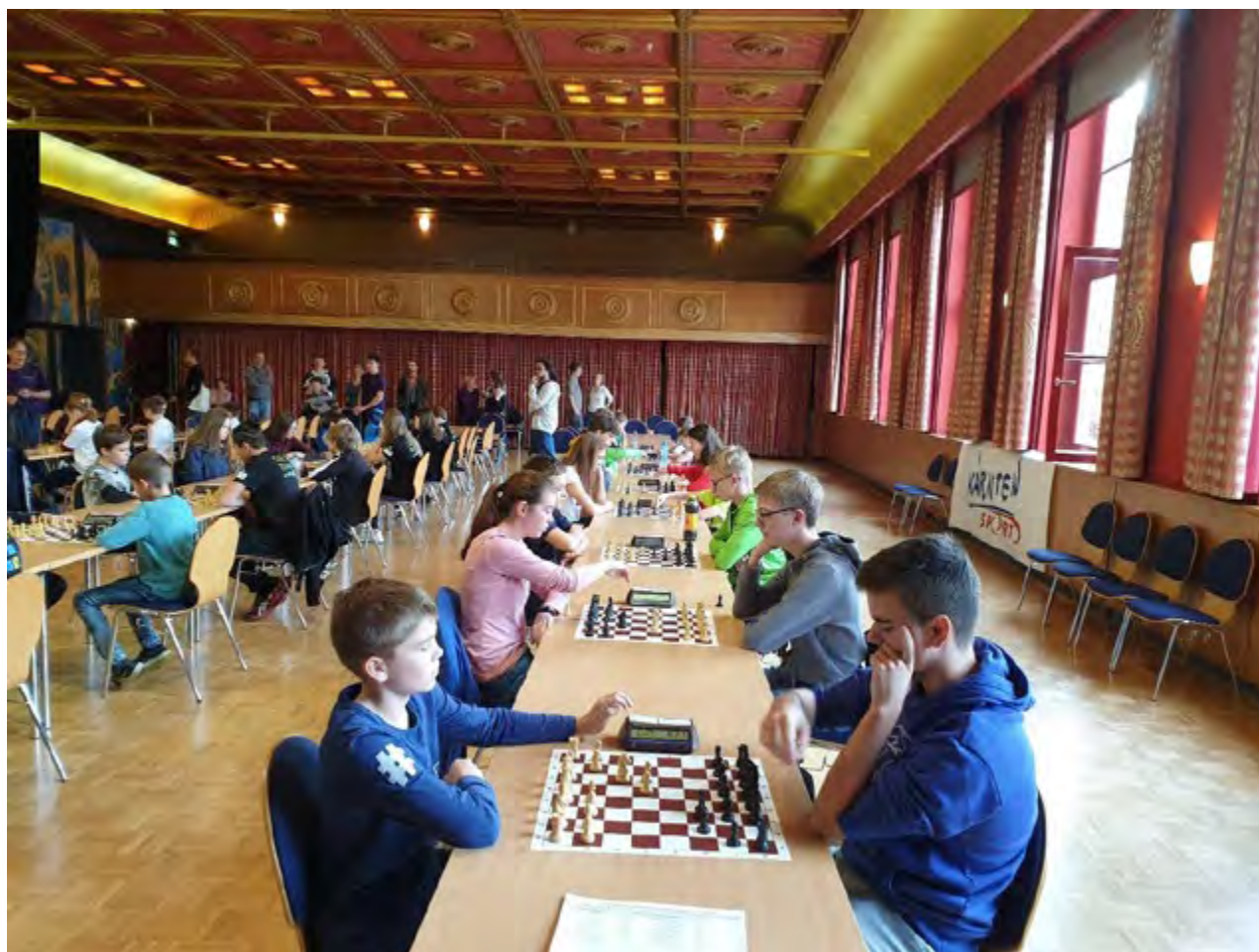
Abbildung 1: Unser Team (rechts sitzend) im Wettkampf mit dem Burgenland

Der Bundesländerbewerb wurde erwartungsgemäß von den Teams aus der Steiermark und Wien dominiert. Überraschend stark präsentierte sich das Burgenland, welches in der letzten Runde sogar die bis dahin immer siegreichen Steiermärker 4,5:3,5 besiegen konnte. Die Steiermark setzte sich aber schlussendlich hauchdünn dank besserer Zweitwertung vor Wien und dem Burgenland durch. Bereits auf Rang 4 war am Ende unser Team zu finden.