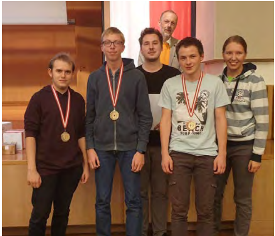
U 18 Rangliste nach 7 Runden