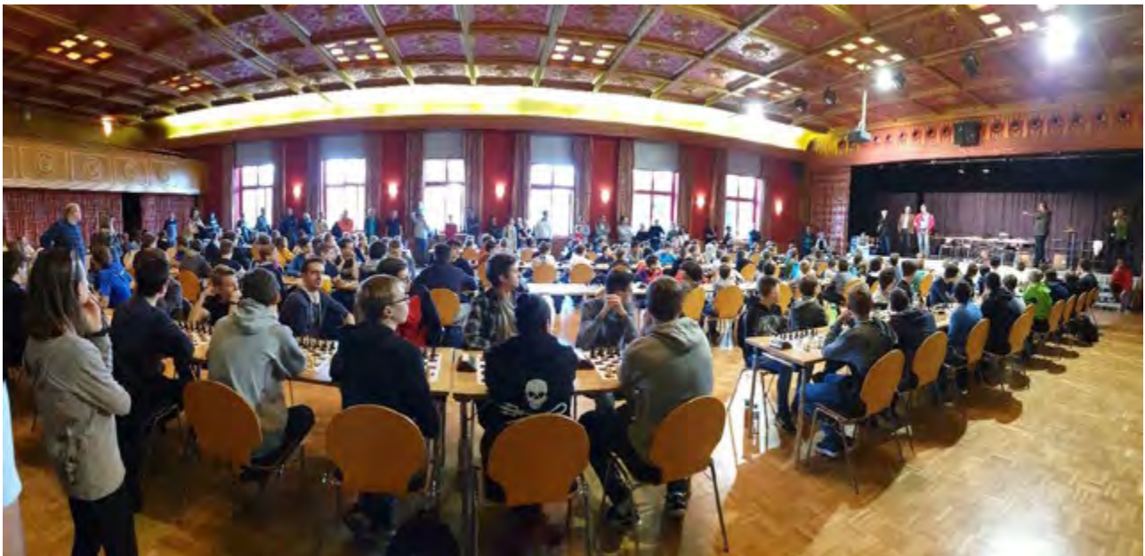
Abbildung 4: Panoramablick in den prall gefüllten Spielsaal. Über 150 Jugendliche traten an