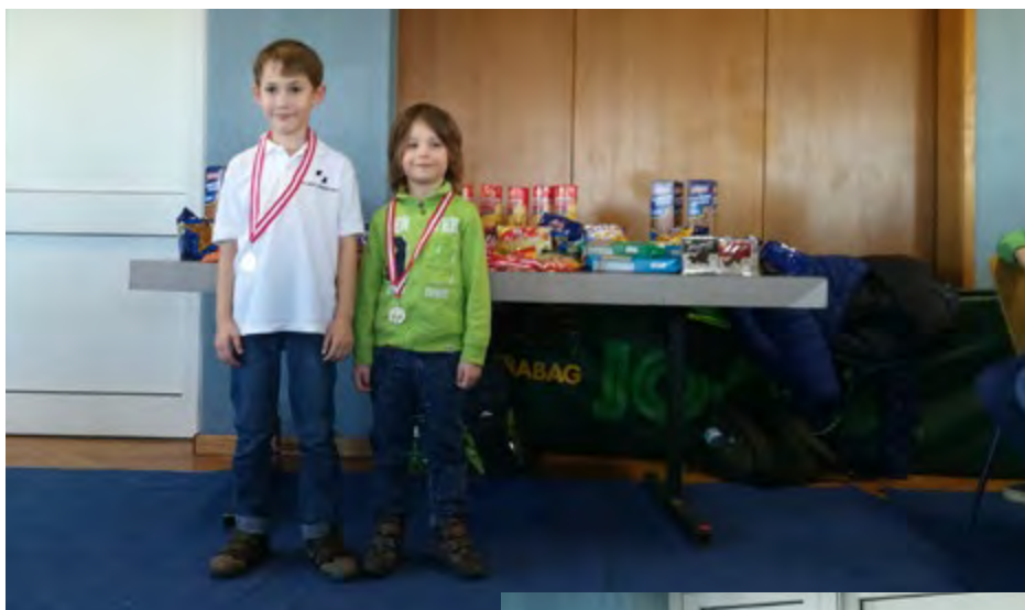
Sieger der U8