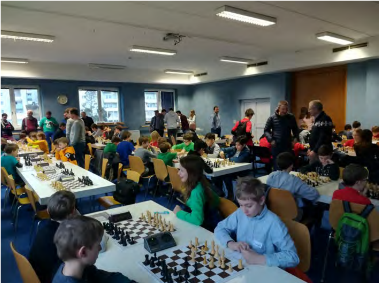
Jugendlandesmeisterschaft im Turnierschach 2020

Am 4. und 5. Jänner kämpften 64 Jugendliche um die Titel in den Altersklassen U8, U10, U12, U14 und U16. Der Schachverein Wartberg und Jugendschachverein Mühlviertel bedanken sich bei den zahlreichen Teilnehmerinnen und Teilnehmern und bei den vielen ehrenamtlichen Helfern, ohne die das Turnier nicht zustande kommen hätte können!