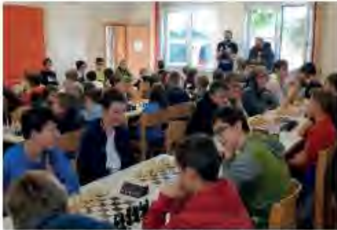
Besonders spannend geht es bei Turnieren zu

Das Jugendschachprojekt Inneres Salzkammergut, das im November 2016 in Bad Goisern gestartet wurde, trägt inzwischen beachtliche Früchte.