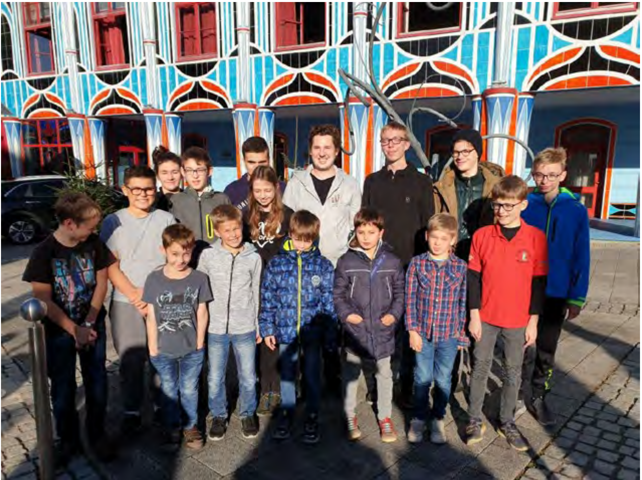
Abbildung 2: Gruppenfoto der OÖ-Delegation an einem etwas zu sonnigen Novembertag

Für die Einzelwettkämpfe traten weitere 8 Landeskaderspieler die Reise nach Kärnten an, um bei dem Kampf um die Medaillen im Schnell- und Blitzschach mitzumischen. Für Medaillen hat es nicht bei jedem gereicht, aber die Erfahrungen, die man bei Bundesmeisterschaften sammeln kann, sind sicher für jeden Einzelnen sehr wertvoll gewesen.