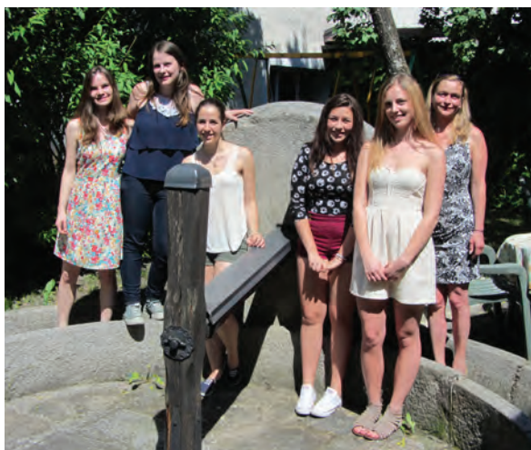
Team Steiermark, Burgenland, NÖ und OÖ