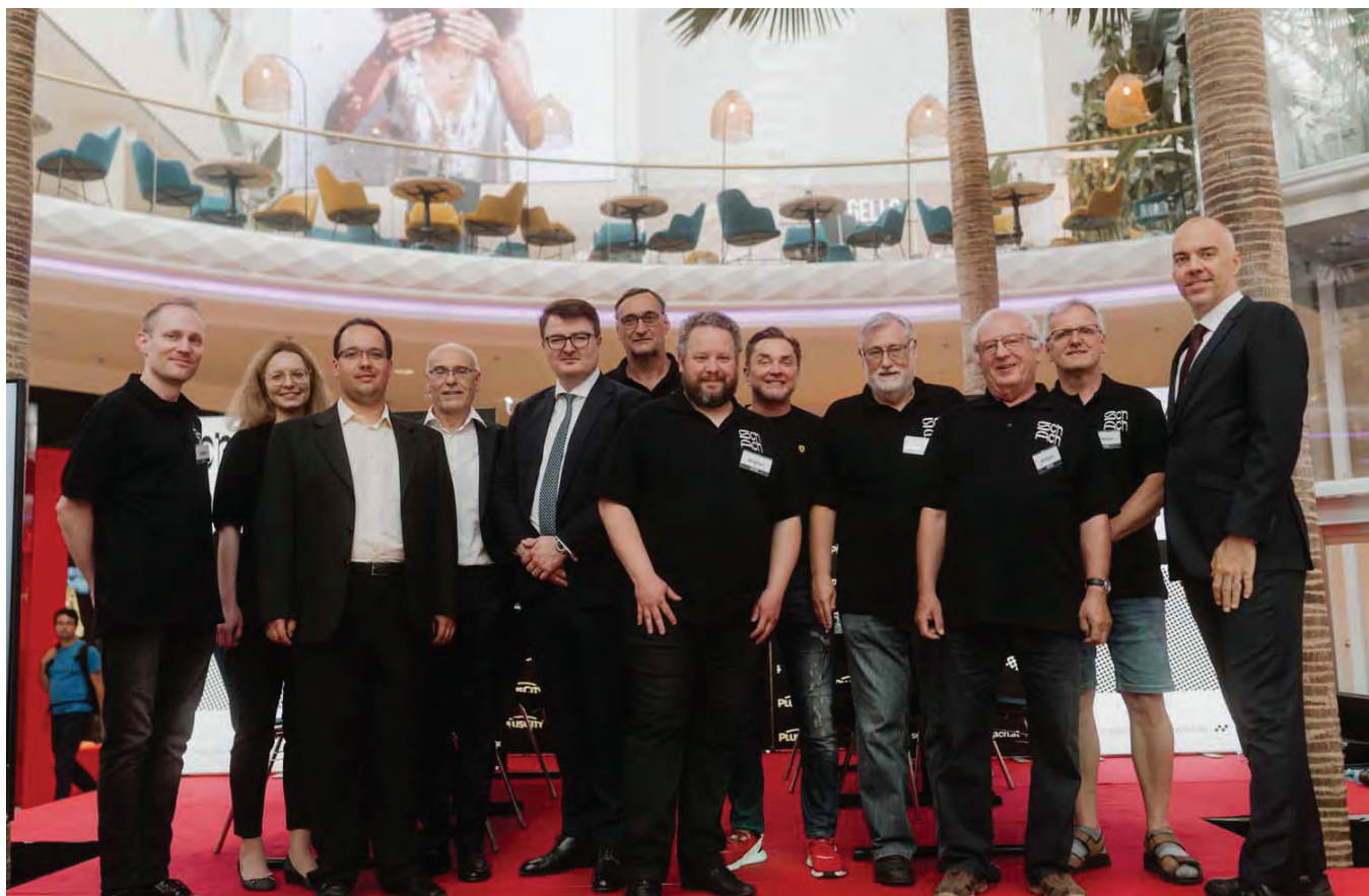
Die Macher und das Arbitrerteam