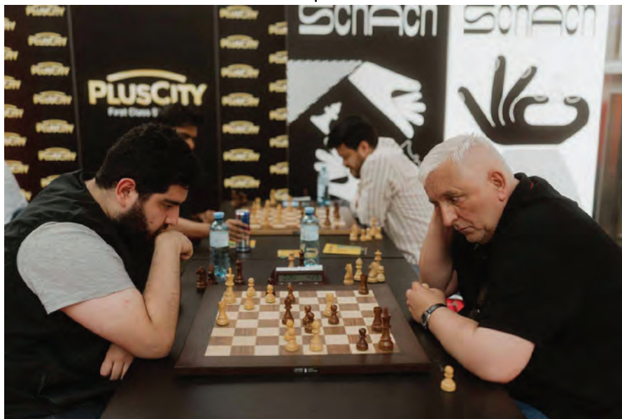
Parham Maghsoodloo und Zdenko Kozul

Meier abzugeben und 8,5 Punkte zu holen sprechen für sich. Er stellte desweiteren unter Beweis, dass man mit 57 Jahren noch lange nicht zum alten Eisen gehört und ohne weiteres jungen Großmeistern das Fürchten lernen kann. Den dritten Platz holte sich hier Parham Maghsoodloo mit 7,5 Punkten.