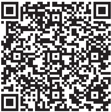
Online kann man die Partie bei ChessBase nachspielen