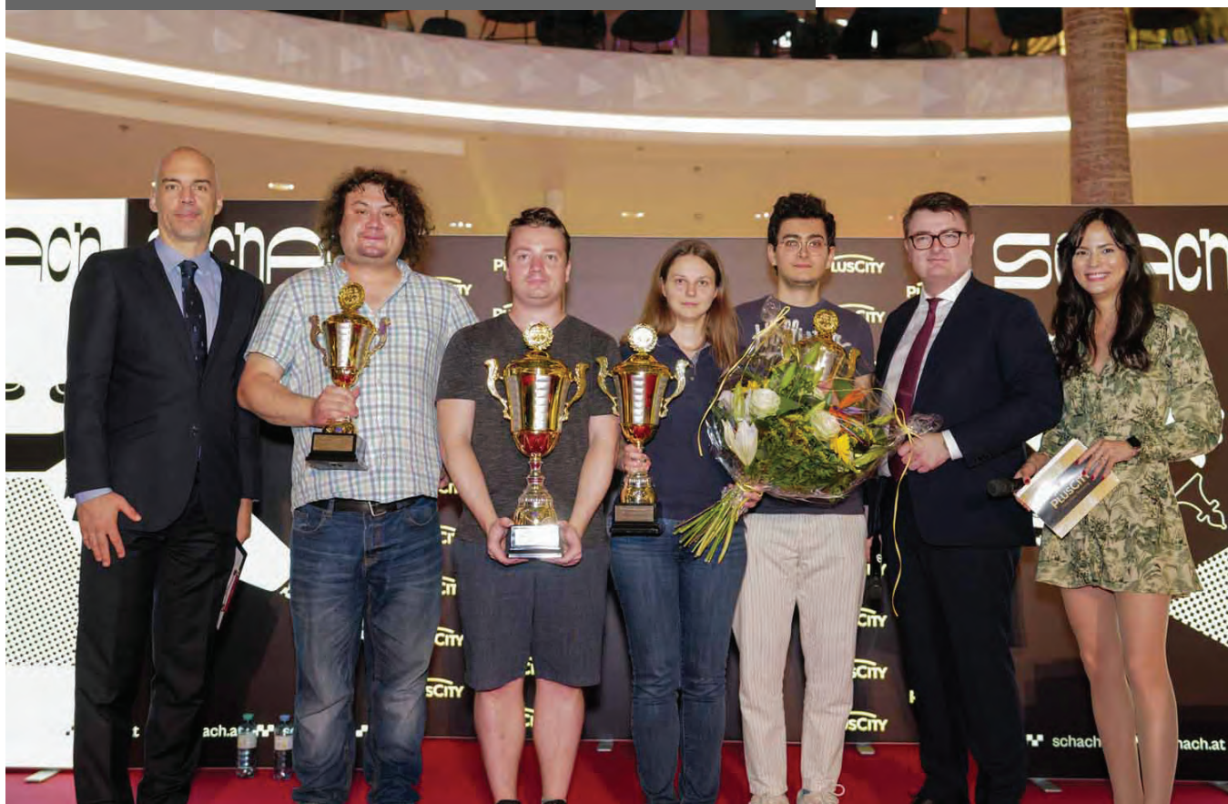
Die Sieger der Blitzturniers