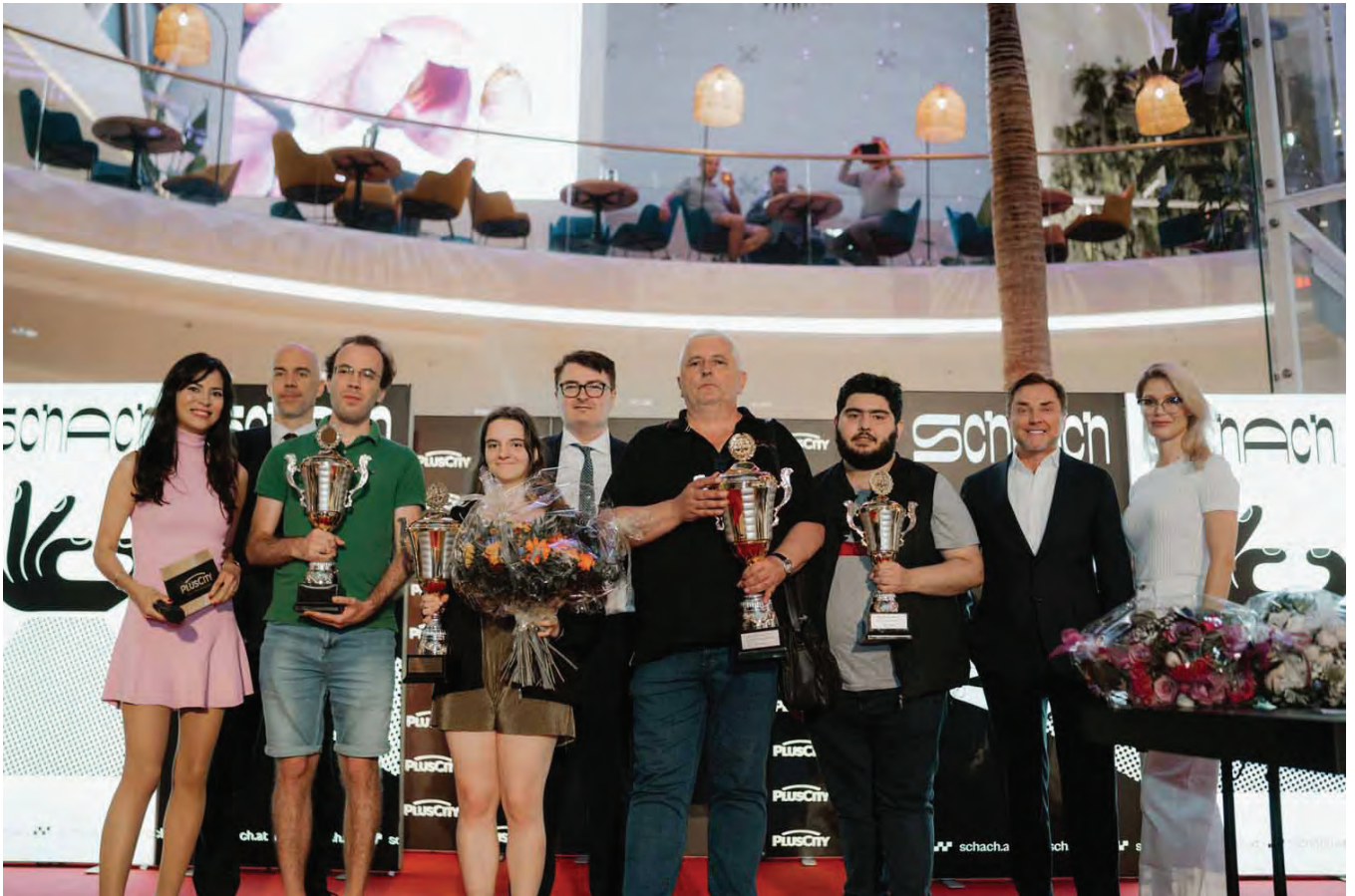
Die Sieger des Rapidturniers mit den Sponsoren