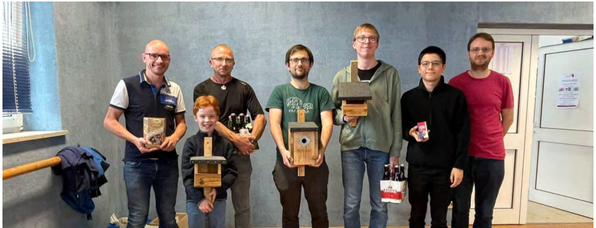
Sieger des Turnieres und Blitzturnieres