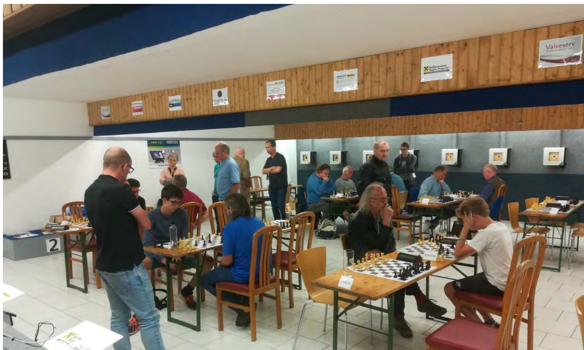
Sechste Runde bei den Sportschützen