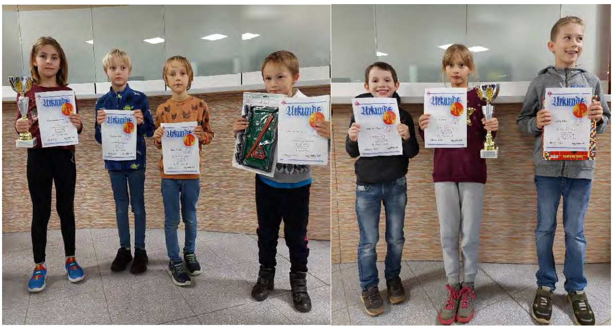
Sieger U8 (links im Bild)/Sieger U10 (rechts im Bild)