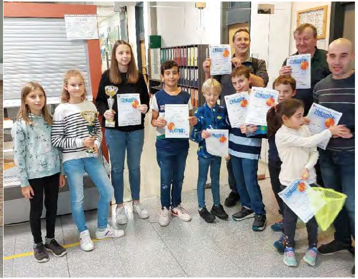
Sieger U12 (links im Bild)/glückliche Schachspieler(rechts im Bild)