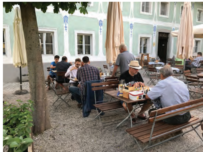
Jung und Alt beim Schachtraining im Gastgarten.