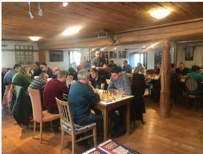
Alle konzentriert bei der Meisterschaft am Schachbrett.