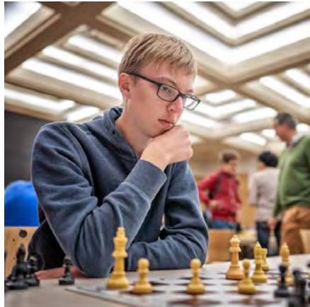
U 18 Rangliste nach 7 Runden