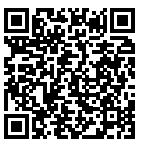
Plus City Grand Prix