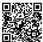
Grandmaster