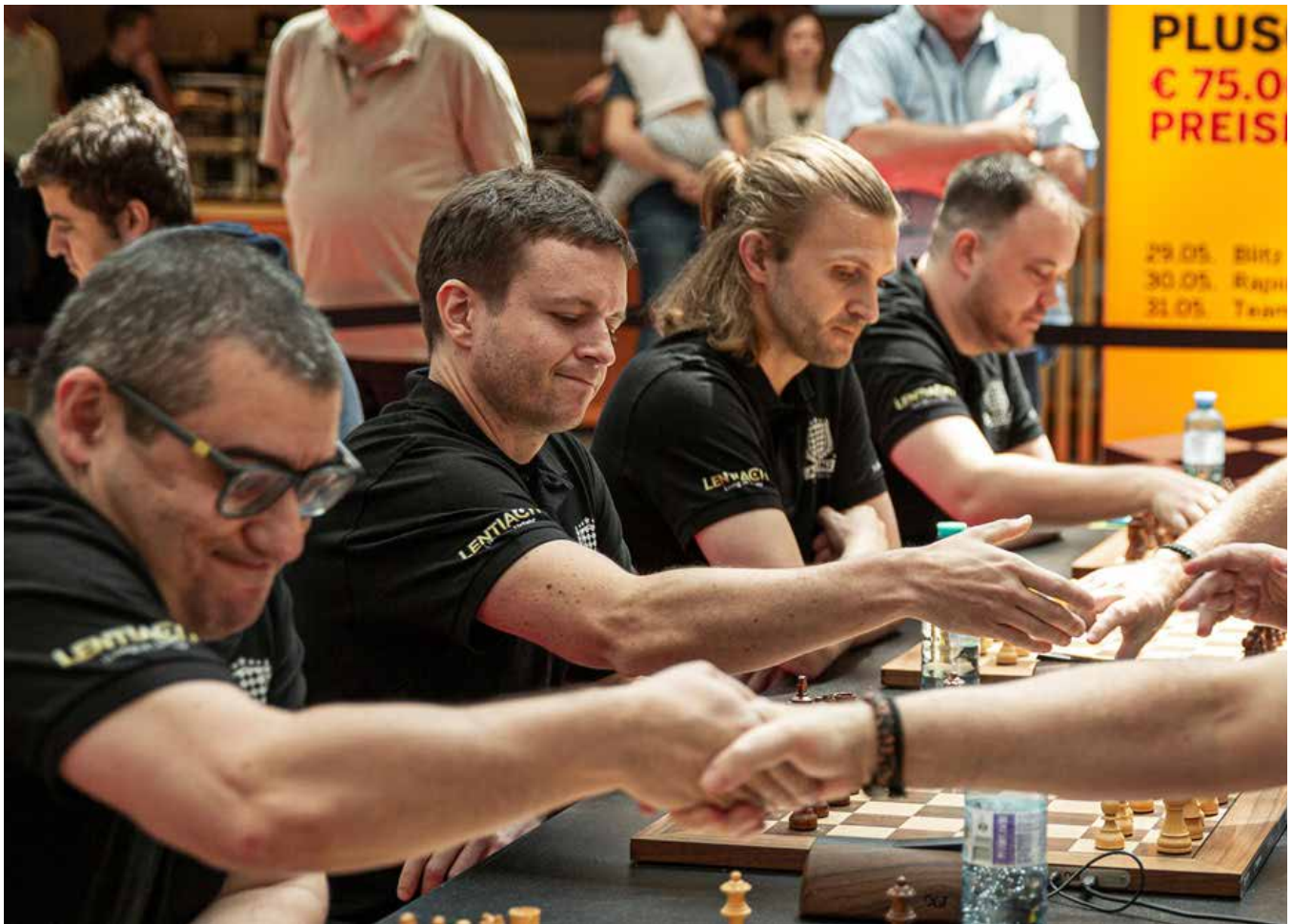
ASV Linz 2