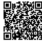
Plus City Grand Prix by Nikiel Przemyslaw