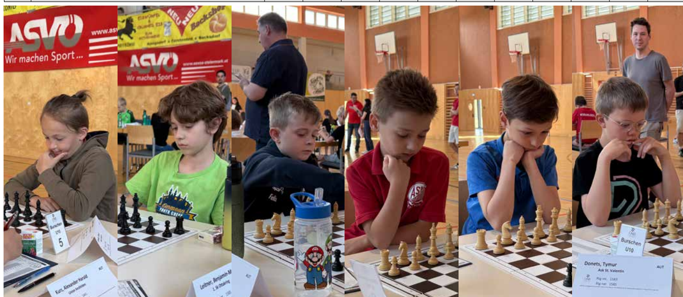
U10 | Endtabelle nach 7 Runden