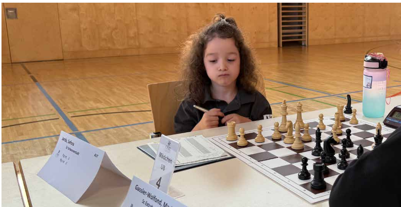
U08 Mädchen | Endtabelle nach 7 Runden