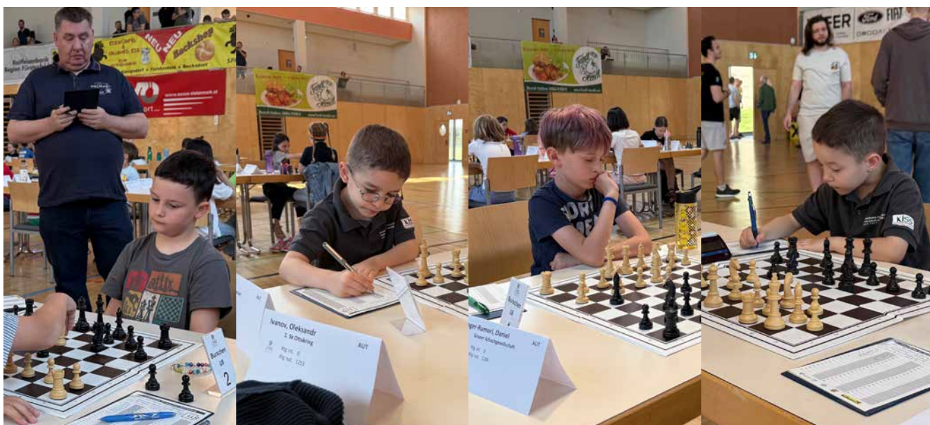
U08 | Endtabelle nach 7 Runden