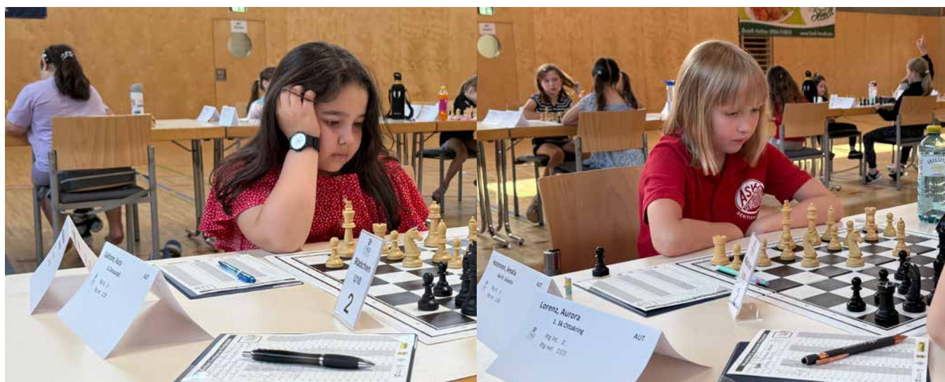
U10 Mädchen | Endtabelle nach 7 Runden