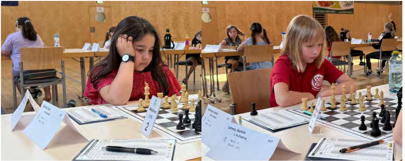
U10 Mädchen | Endtabelle nach 7 Runden