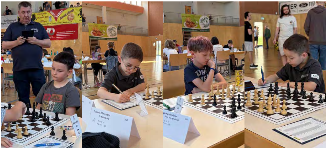
U08 | Endtabelle nach 7 Runden