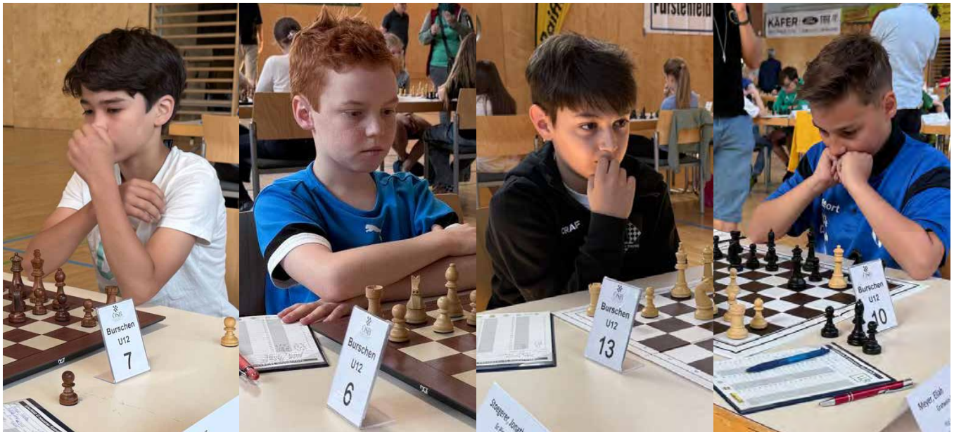
U12 | Endtabelle nach 7 Runden