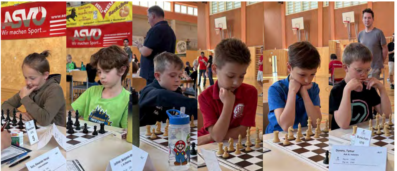
U10 | Endtabelle nach 7 Runden