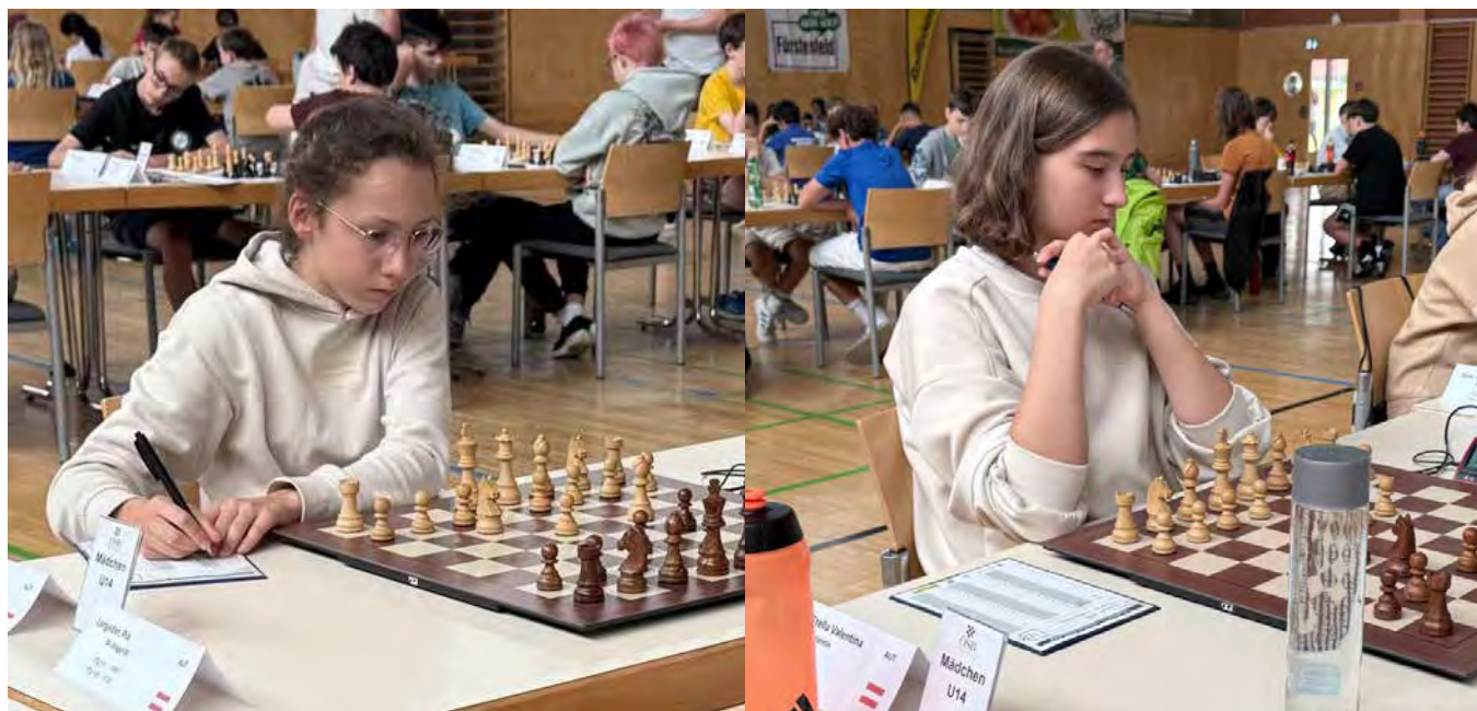
U14 Mädchen | Endtabelle nach 7 Runden