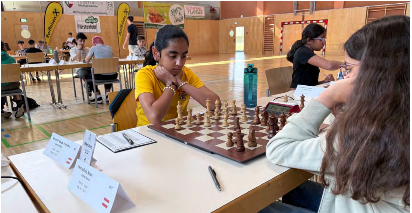
U12 Mädchen | Endtabelle nach 7 Runden