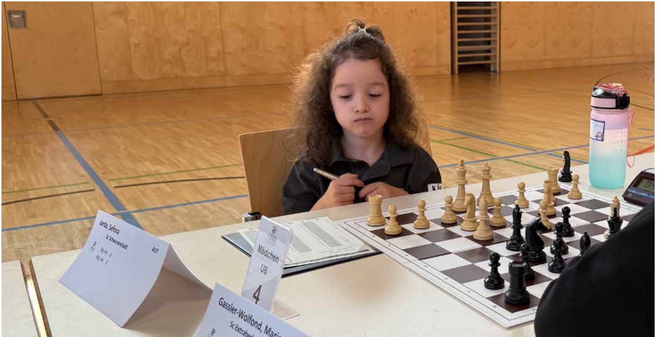
U08 Mädchen | Endtabelle nach 7 Runden