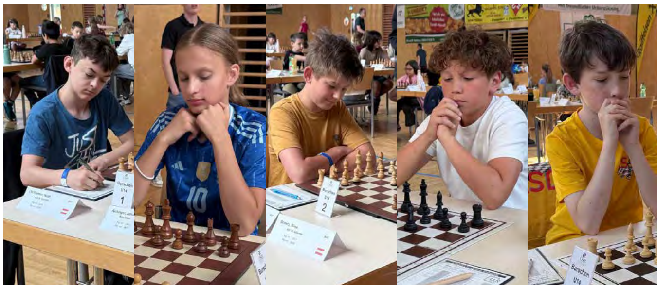
U14 | Endtabelle nach 7 Runden